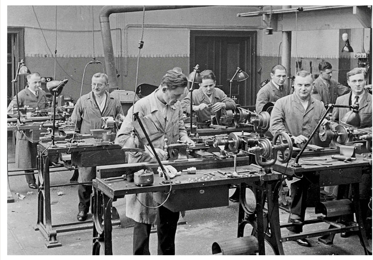
Maschinensaal Berlin Brandenburgstraße 43 Mechanical turnery Berlin Brandenburgstraße 43