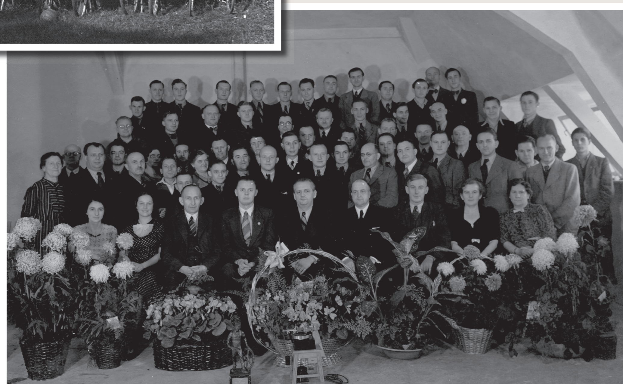
Belegschaft am Tage des 10-jährigen Bestehens (26. November 1938) Staff on the day of the tenth anniversary (26th November 1938)