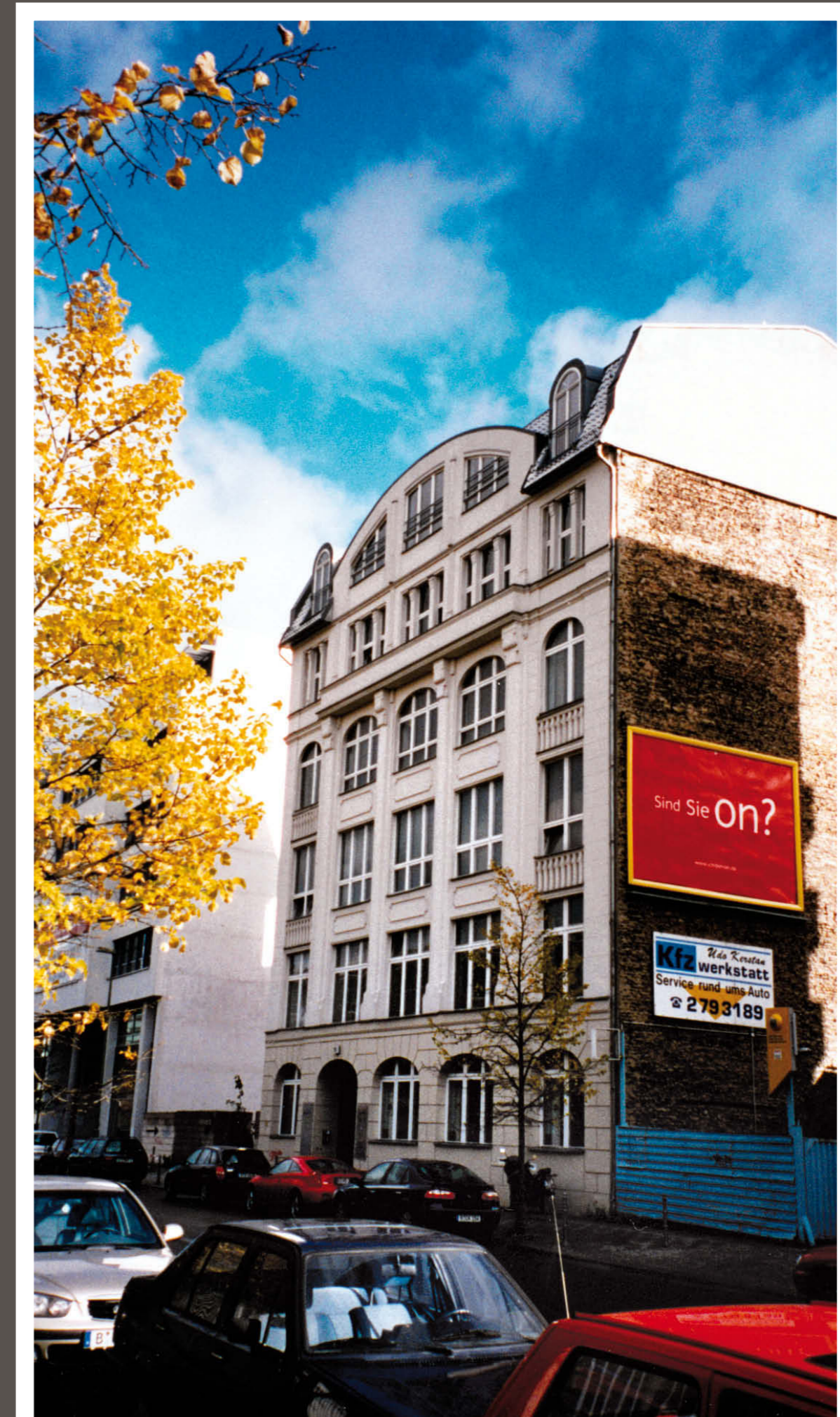
Berlin Michaelkirchstraße 15, nach Restaurierung