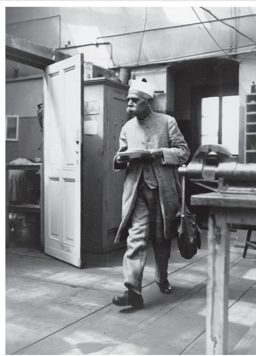
Einer der ersten Auslandskunden One of the first foreign customers