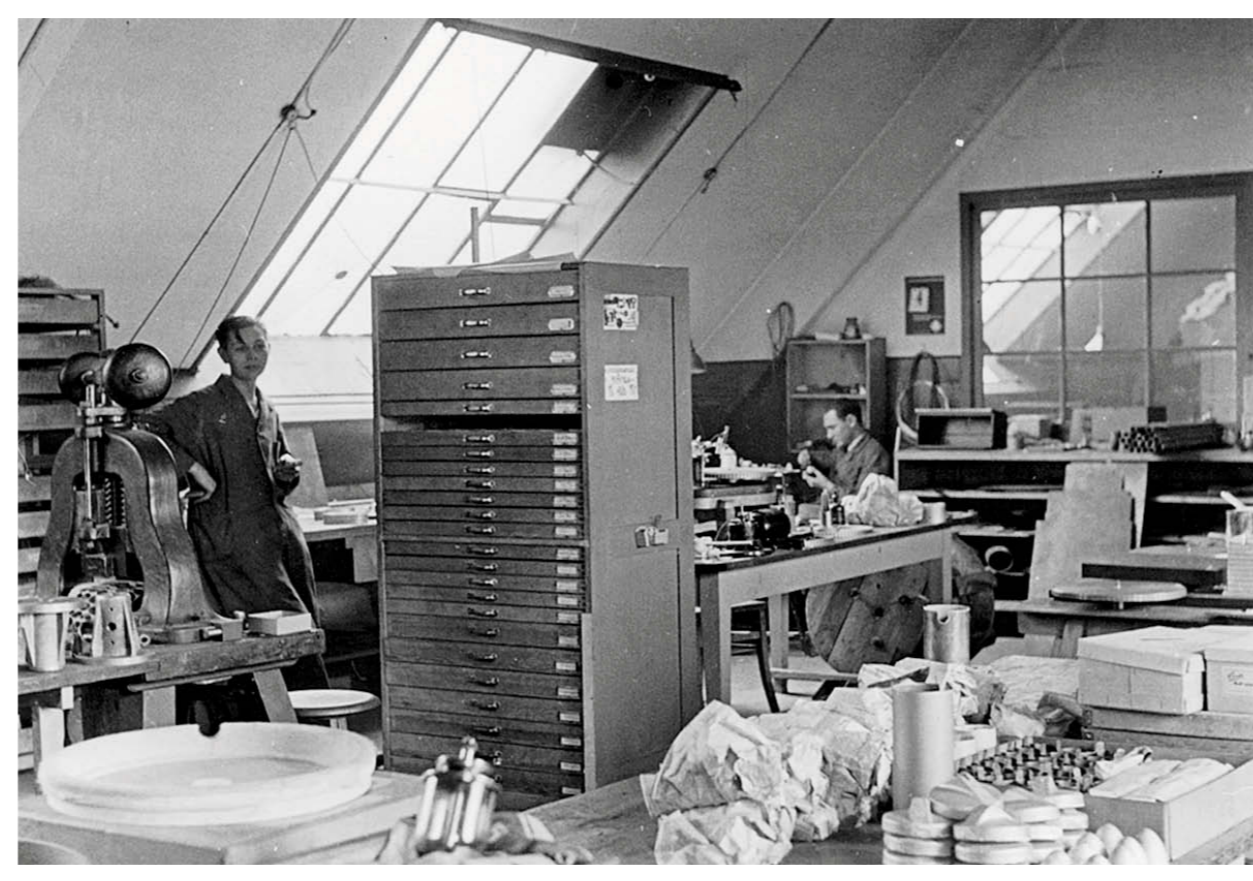
Montage Berlin Brandenburgstraße 43 Assembly Berlin Brandenburgstraße 43