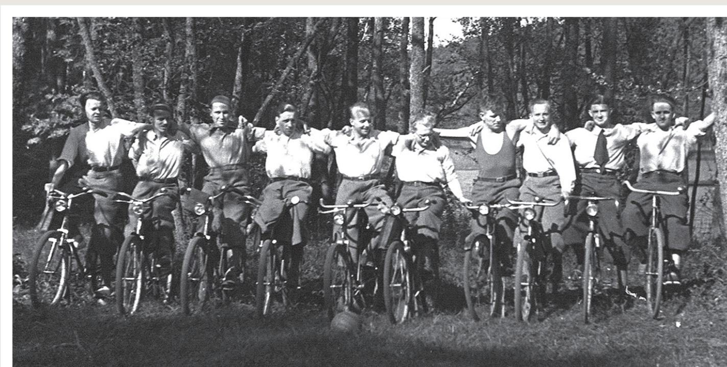
Radtour 1935 Bicycle tour 1935