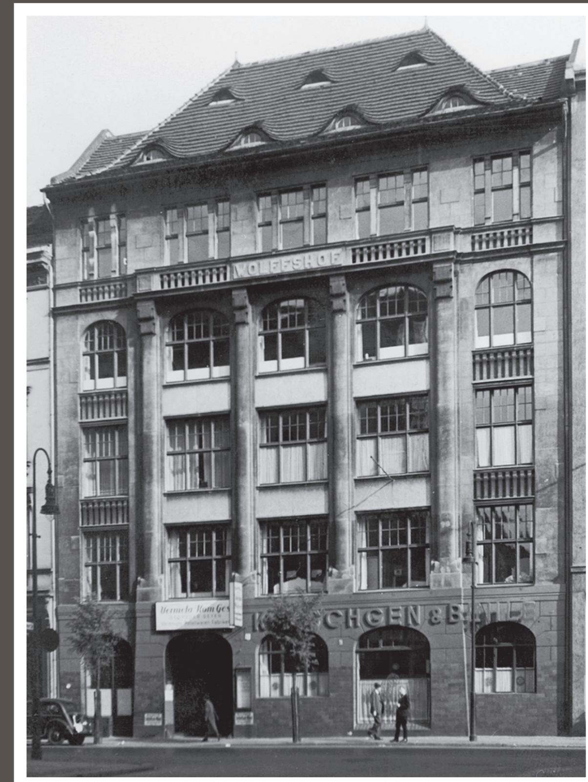
Berlin Michaelkirchstraße 15