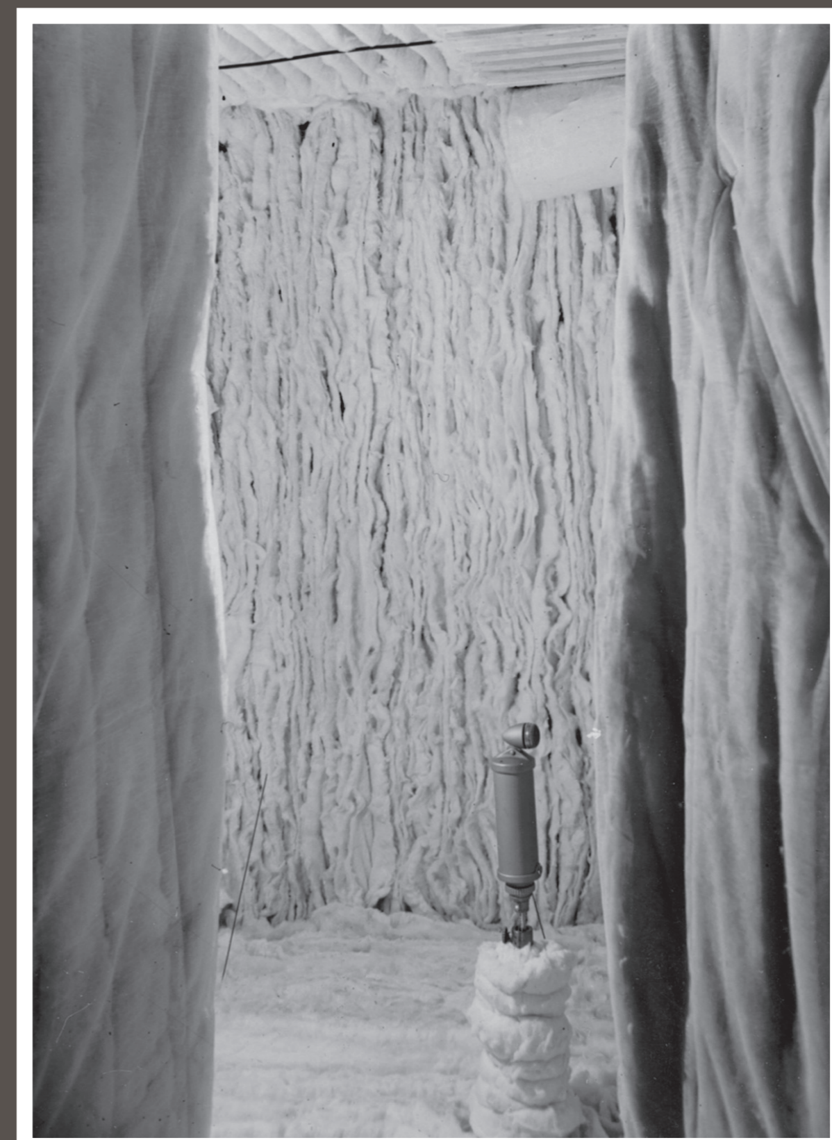
Schallmessraum Anechoic chamber